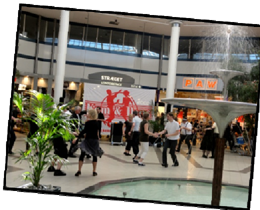
Store Torv i Kolding Storcenter