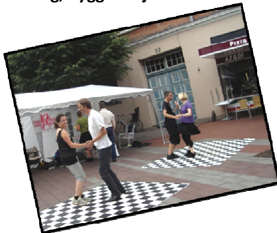
Foreningernes dag, Søndergade i Kolding