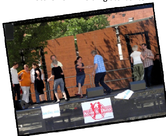
Dansens dage, Sct. Nicolai Komplexet i Kolding